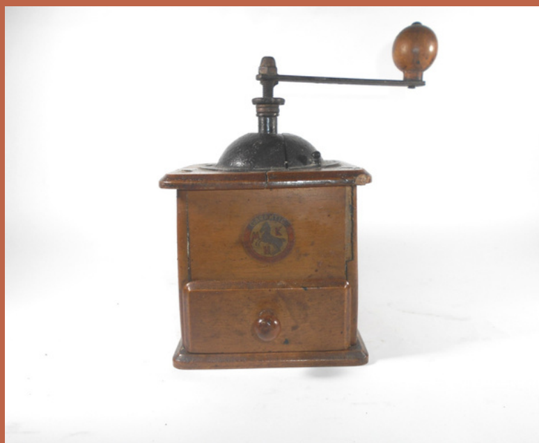
Moinho de especiarias