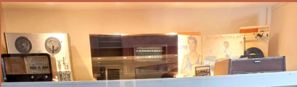
PÁGINA 09 | VISITE A SALA DE COMUNICAÇÃO E OUTRAS