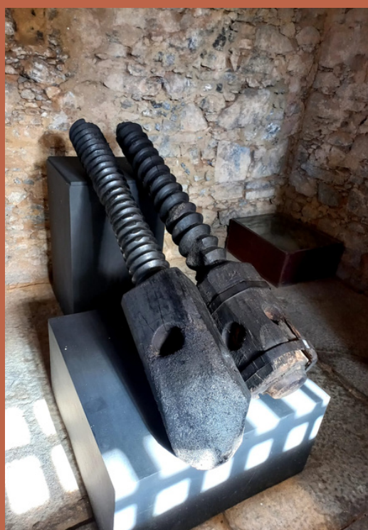
Partes de uma antiga casa de farinha de Maricá