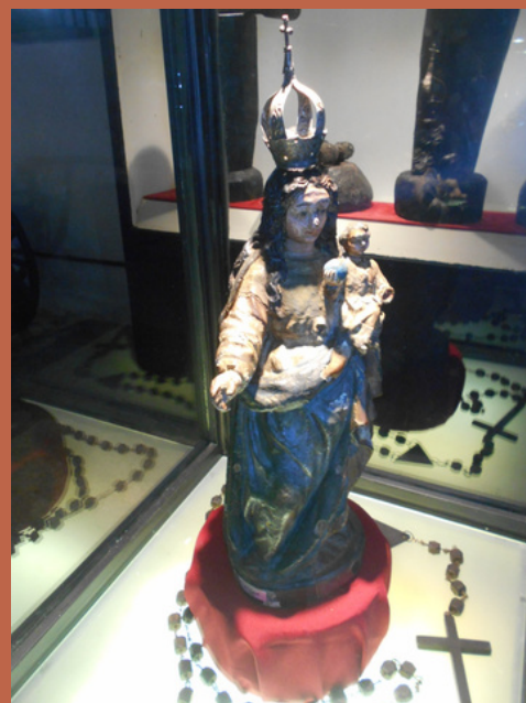
Santa do pau oco. Usada para contrabando de joias e pedras preciosas Imagem sacra do Século XVIII, em madeira, coleção de Yone Cunnha