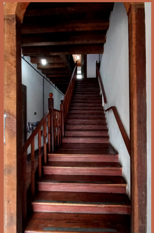
PÁGINA 00 | OS 26 DEGRAUS QUE CONTAM A HISTÓRIA DE MARICÁ