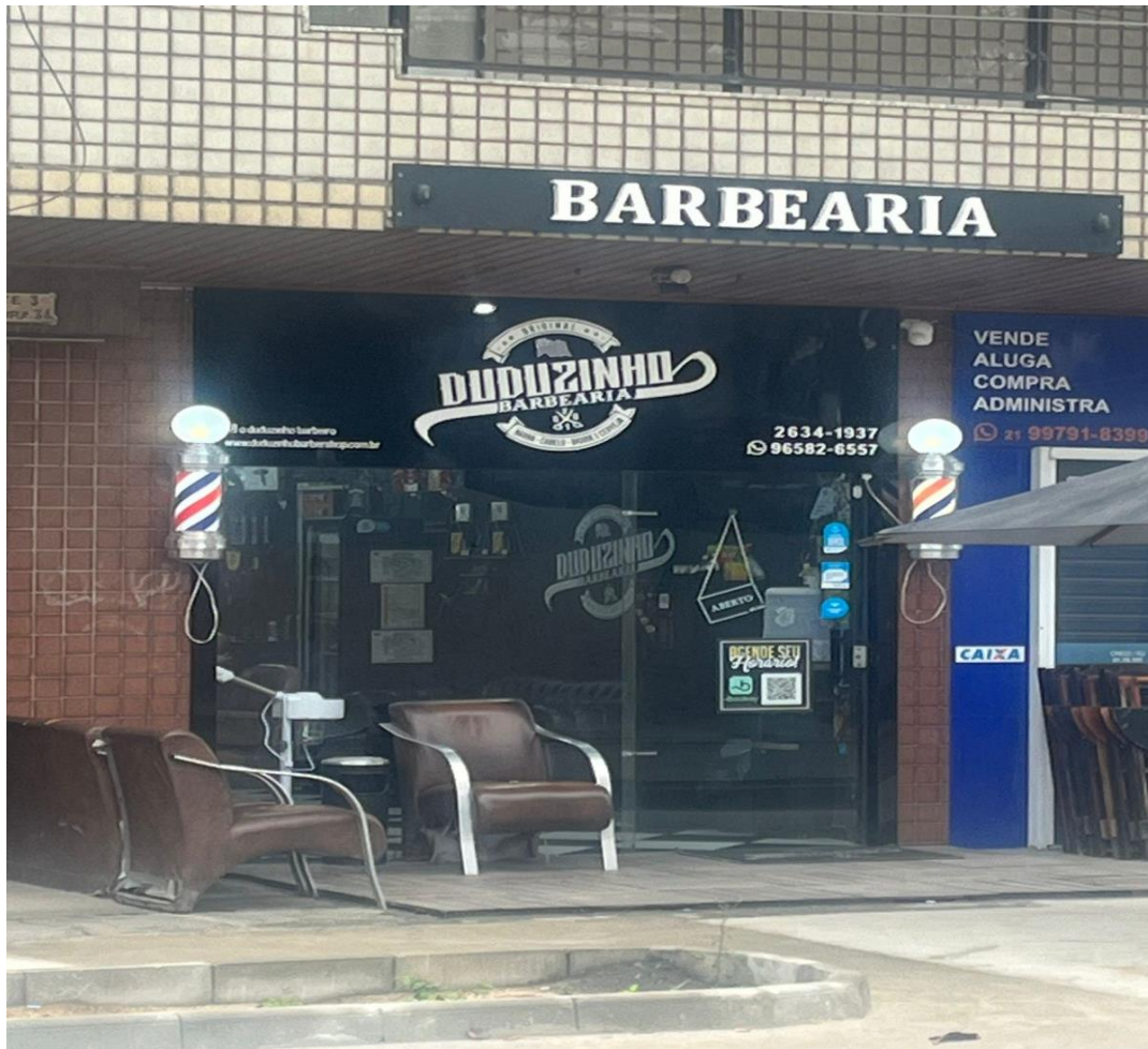
Figura 3 – Local declarado pela empresa Vitae para as instalações dos cursos que serão ministrados

A VITAE declara uma localidade em Maricá e anexa um alvará de um CNPJ que não tem nenhuma relação com a empresa matriz, o CNPJ é de uma barbearia, que funciona em Itaipuaçu, uma loja de cerca de 35m2, ou seja, um local, que nada se enquadra com o que é solicitado em Edital, como será ministrado diversos cursos, alguns com cerca de 20 alunos dentro de uma barbearia? Segue foto do local abaixo: