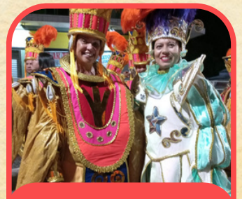
União de Maricá 2024