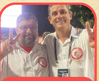
Ala da Diretoria União de Maricá 2024