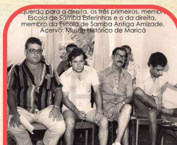
Organizadores e diretoria carnavalesca - Década de 70