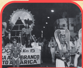
GRES Camisa azul e Branco