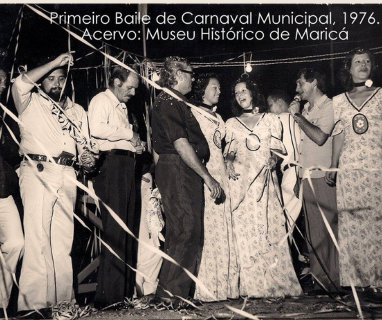
Primeiro Baile de Carnaval Municipal, 1976.