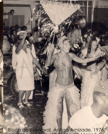
Bloco de carnaval Antiga Amizade, 1976.