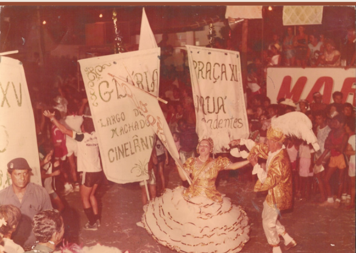
Bloco de Carnaval Esferinhas 1978