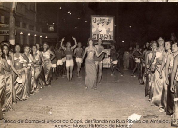
Bloco de Carnaval Unidos do Capri, desfilando na Rua Ribeiro de Almeida, 1975.