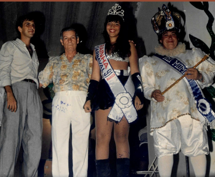
Coroação do Rei Momo e Rainha de Carnaval 1991

Acervo: Milena Costa e Museu Histórico de Maricá Pesquisa Cezar Brum