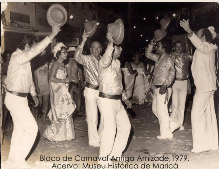
Bloco de Carnaval Antiga Amizade, 1979.