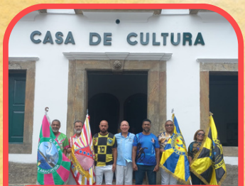
Bandeiras das Escolas tradicionais de Maricá