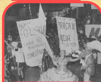
Bloco da Harmonia