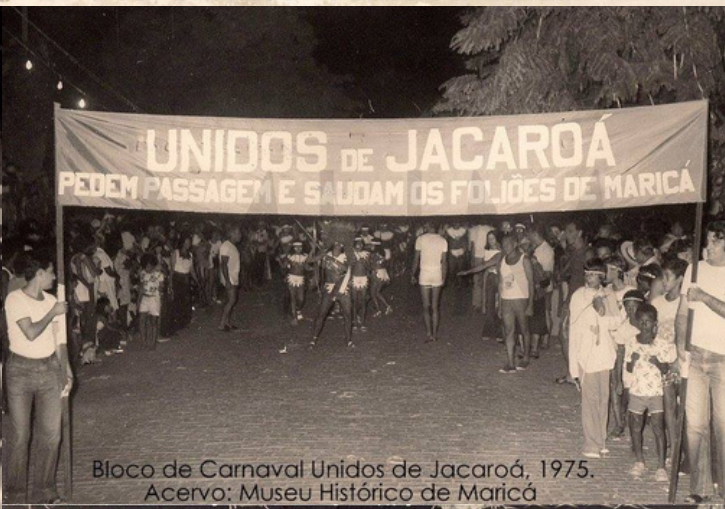
Bloco de Carnaval Unidos de Jacaroá, 1975.