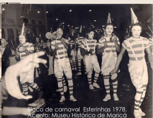
Bloco de carnaval Esferinhas 1978. Acervo: Museu Histórico de Maricá