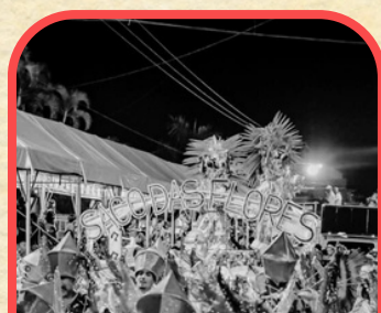
Unidos do Saco das Flores - Fundada em 2004