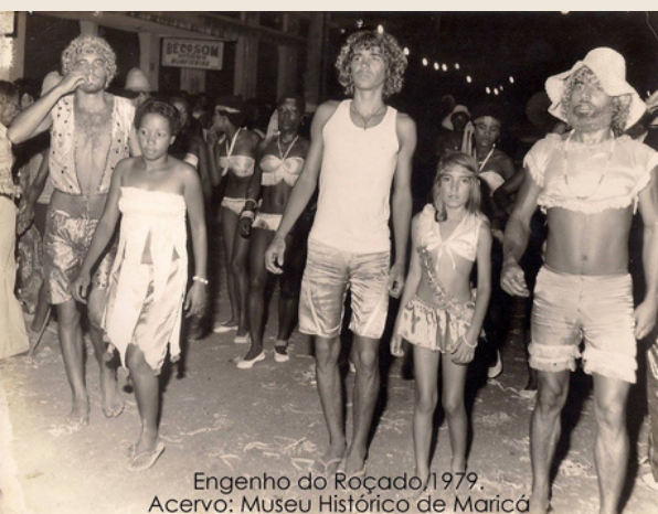
Engenho do Roçado, 1979.

Foliões do carnaval em Maricá data de 1927, 1930, 1970.