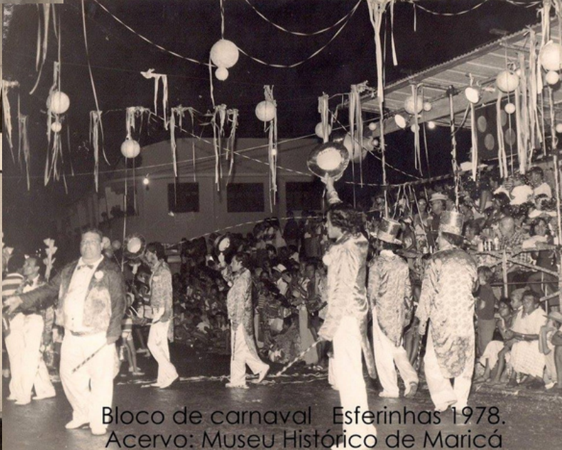
Bloco de carnaval Esferinhas 1978.