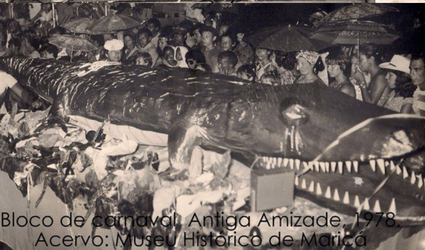
Bloco de carnaval, Antiga Amizade, 1978.