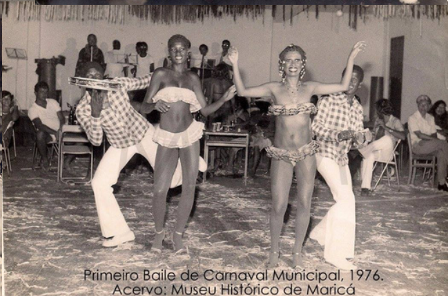
Primeiro Baile de Carnaval Municipal, 1976.