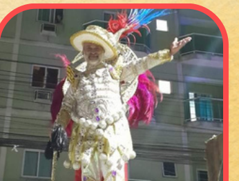
Retorno das escolas tradicionais de Maricá