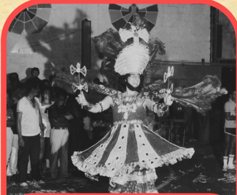
Xangô do Salgueiro