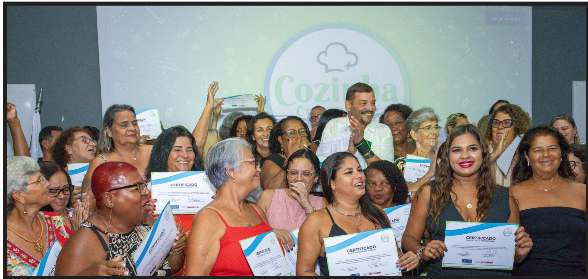
Prefeitura de Maricá forma 150 alunos no projeto sustentável 'Cozinha Criativa' - https://www.marica.rj.gov.br/noticia/prefeitura-de-marica-forma-150-alunos-no-projeto-sustentavel-cozinha-criativa/

A Autarquia Municipal de Serviços de Obras de Maricá torna público que em virtude do cancelamento da Ata de Registro de Preços n.º 21/2025, do Pregão Eletrônico supracitado, cujo o objeto é o Registro de preço para Contratação de empresa para Aquisição de galerias pré fabricadas de concreto, convocamos a empresa INDÚSTRIA E COMÉRCIO DE PRÉ MOLDADOS CRUZEIRO DO SUL LTDA, participante do cadastro reserva e informamos que a continuação do certame fica marcada para o dia 05/02/2026 às 9h. Maiores informações através do Portal da Transparência de Maricá: www.marica.rj.gov.br/transparencia >>licitações em andamento>>editais>> SOMAR, pelo e-mail cplsomar@gmail.com . ou pelos telefones: (21) 3731-4912 e (21) 2637-1581 ramal 1810 ou (21) 99812-5224.