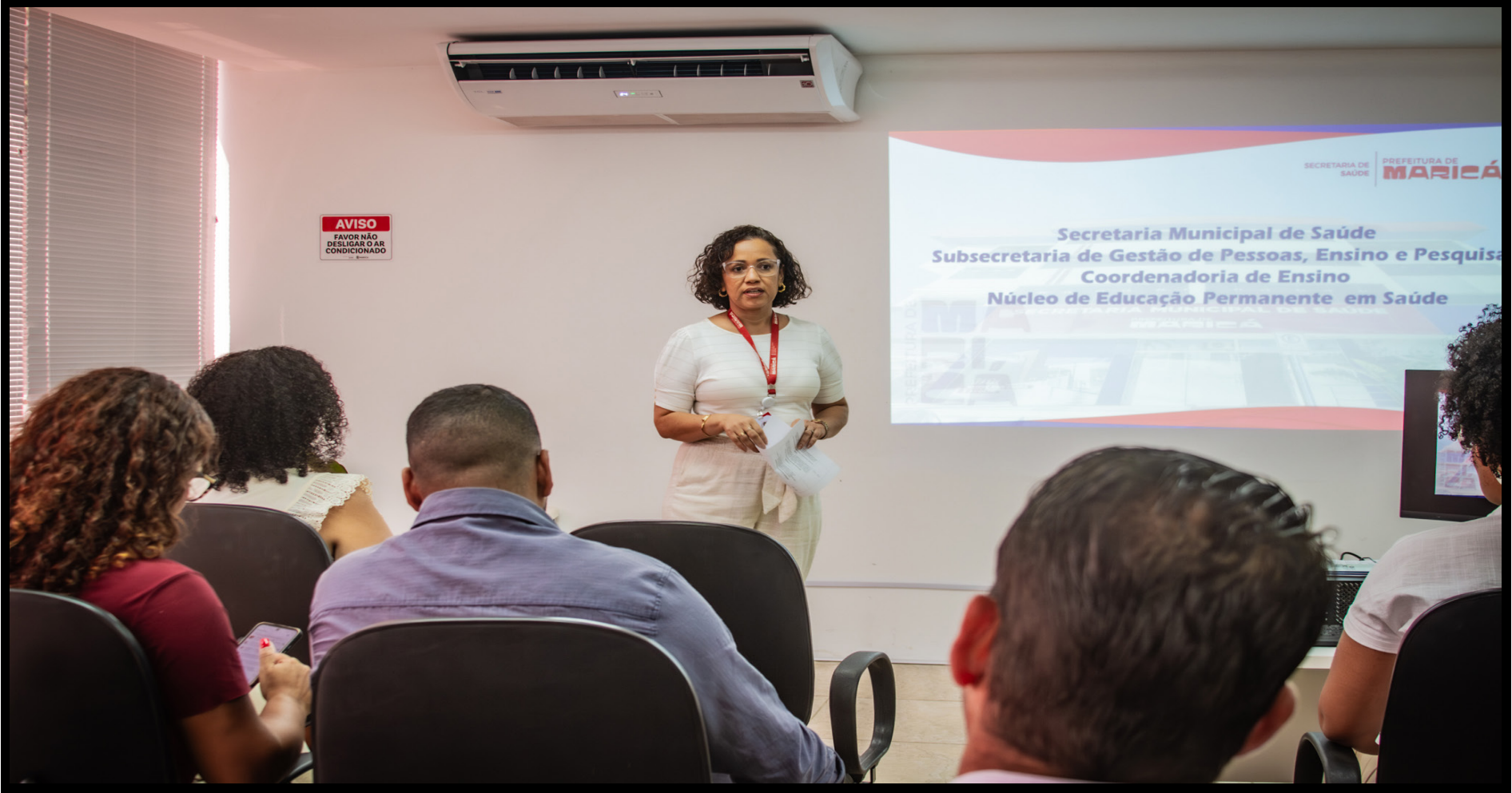
Maricá fortalece a qualificação dos trabalhadores do SUS com encontro voltado à educação permanente - https://www.marica.rj.gov.br/noticia/marica-fortalece-a-qualificacao-dos-trabalhadores-do-sus-com-encontro-voltado-a-educacao-permanente/