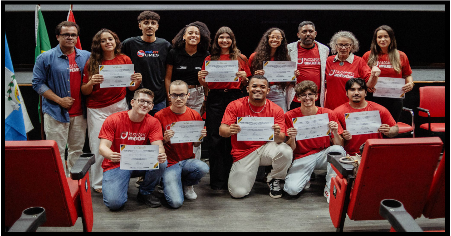
PASSAPORTE UNIVERSITÁRIO: PREFEITURA DE MARICÁ ENTREGA CERTIFICADOS PARA NOVOS ALUNOS DE MEDICINA- https://www.marica.rj.gov.br/noticia/passaporte-universitario-prefeitura-de-marica-entrega-certificados-para-novos-alunos-de-medicina/